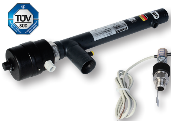
EWT 80-41 mit Strömungsschalter

Für mobile Anforderungen und exponiert gelegene Einsatzorte, wo keinerlei stationäre Heizquelle zur Verfügung steht. Perfekte Verarbeitung und langlebige Funktionalität - Außenmaterial aus hochwertigem Edelstahl (AISI 316), Heizstab aus Incoloy 825. TÜV-zertifiziert, setzen sie qualitative Maßstäbe. Sonderanfertigungen aus Titan sind optional erhältlich.