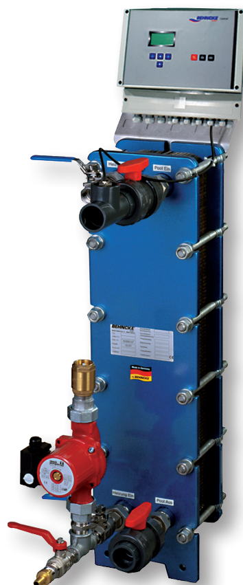
Platten-Wärmetauscher TSC 910 als Kompaktanlage

Durch ihre kompromisslos hochqualitative Auslegung eignen sich BEHNCKE-Platten-Wärmetauscher hervorragend - neben dem Einsatz im privaten Schwimmbad - auch für Anwendungen im öffentlichen, bzw. im